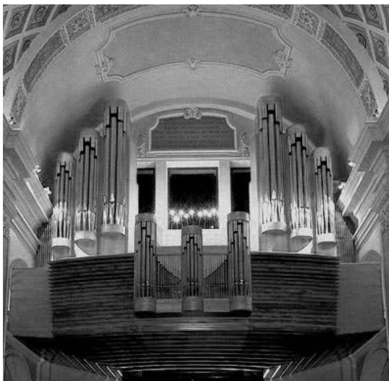
Organo Nuovo Mascioni Chiesa Santa Maria dei Miracoli a Morbio Inferiore