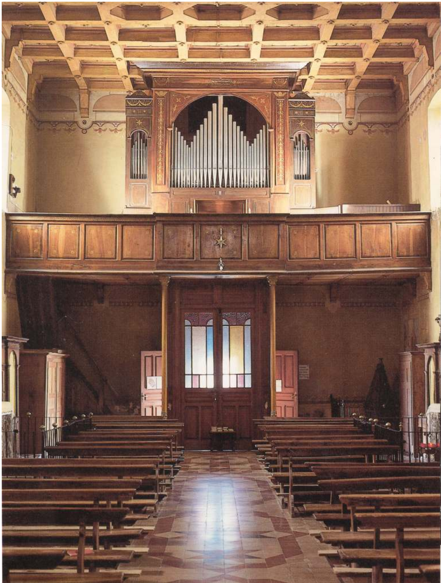
Palagnedra Chiesa Parrocchiale Marzoli e Rossi, 1914