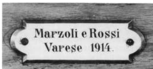
Targa della ditta e data di costruzione

Nel restauro eseguito da Livio Vanoni nel 1979, il Registro Violino 8' è stato sostituito con un Nazardo 2. 2/3 allo scopo di dotare l'organo di una piccola mutazione.